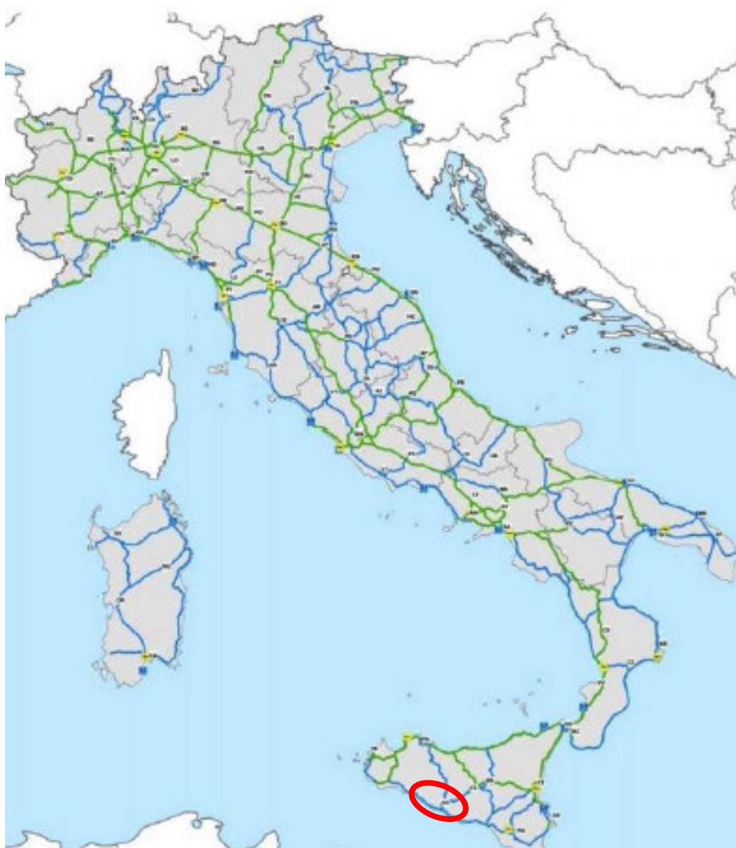
Fig. 5/A: Rappresentazione della Rete stradale appartenente allo SNIT (Sistema Nazionale Integrato dei Trasporti) di 1° e 2° livello). In rosso è evidenziata l'area di intervento

Come si evince dalla Figura 5/A, l'opera in progetto si inserisce nell'area Sud-Ovest-della Regione Sicilia ed attraversa le aree delle Province di Caltanissetta e di Agrigento